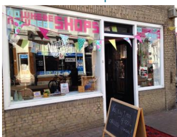
Haagdijk / 1 NOWHERE shop