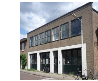
Zandbergweg 97 / 11 ateliers