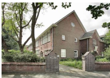
Overakkerstraat 192-194 / 12 ateliers