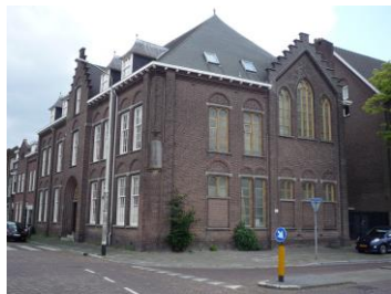
Haagweg 21 / 18 ateliers