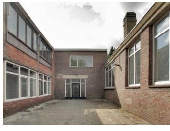
Van Schootenstraat 23/23a / 13 ateliers