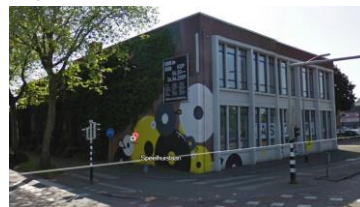
Speelhuislaan 171 / 33 ateliers/ 2 expositieruimtes