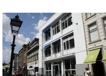
Reigerstraat 16 / 9 kantoren