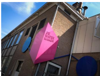
Hoornwerkstraat I / De Watermaker / 17 kantoren