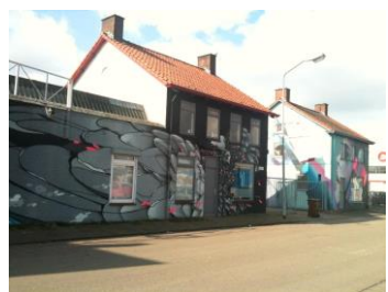
Veilingkade 8/9 / 9 ateliers