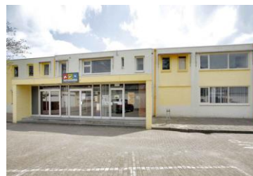
Teteringsedijk 89D/E / 24 ateliers