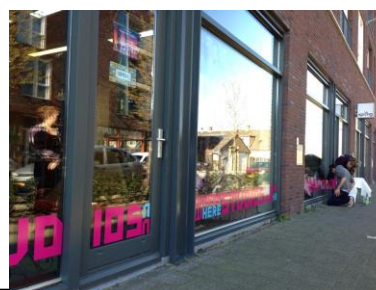
SPRING / 6 NOWHERE studios